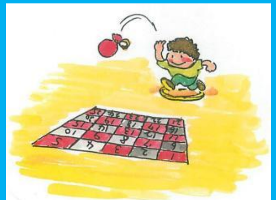
スローイングビンゴ