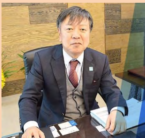
障がい者スポーツ指導者協議会 北信越ブロック ブロック長