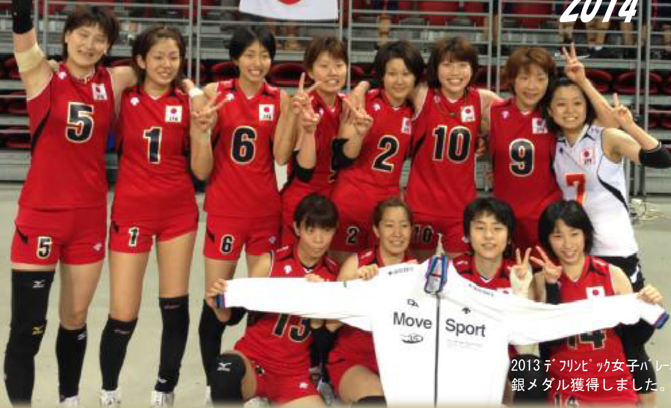
2013 デフリンピック女子バレーボールチーム 銀メダル獲得しました。

平成 25 年 2 月 9 日 (日) 13~16 時 兵庫県立総合リハビリテーションセンター